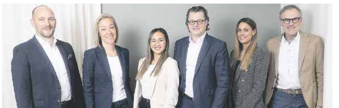
Global vernetzt, national tätig, in Winterthur angekommen: Das Ginesta Team für den Verkauf und die Vermarktung von Immobilien aller Art.