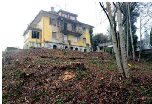
Stand 50 Jahre leer und wurde letztes Jahr abgerissen: Die Stefanini-Villa im Rychenberg-Quartier.

2021 machte die Terresta Verwaltungs AG Tabula rasa und riss die Villa ab. Geplant sind nun rund ein Dutzend Wohnungen eines besonders «nachhaltigen» Baus. Nächstes Jahr findet der Architekturwettbewerb statt. Mit dabei ist auch ein junges Architektenteam aus Lausanne, das Büro Baraki. Sie hatten letzte Woche im Zentrum Architektur Zürich die «Wilde Karte» gezogen und sich mit ihren Prinzipien zum nachhaltigen Bauen gegen drei weitere Nachwuchstalente durchgesetzt.