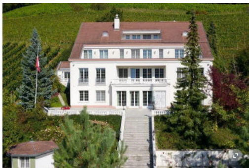
Ist mit sieben Millionen Franken wohl eines der teuersten Objekte in Stadt und Region: Die Heuberger-Villa am Goldberg.

10 Zimmer, 622 Quadratmeter Wohnfläche, 2000 Quadratmeter Land – kurz «Best of Winterthur» ist diese Villa am Goldberg gemäss Inserat und damit sieben Millionen Franken wert. Bibliothek, Indoorpool, Lift und eine Terrasse mit Aussicht auf die ganze Stadt sind weitere Zückerchen, mit denen die Ginesta Immobilien AG von der Zürcher Goldküste die stolze Villa anpreist – seit rund acht Monaten. Das Objekt ist nach wie vor ausgeschrieben.