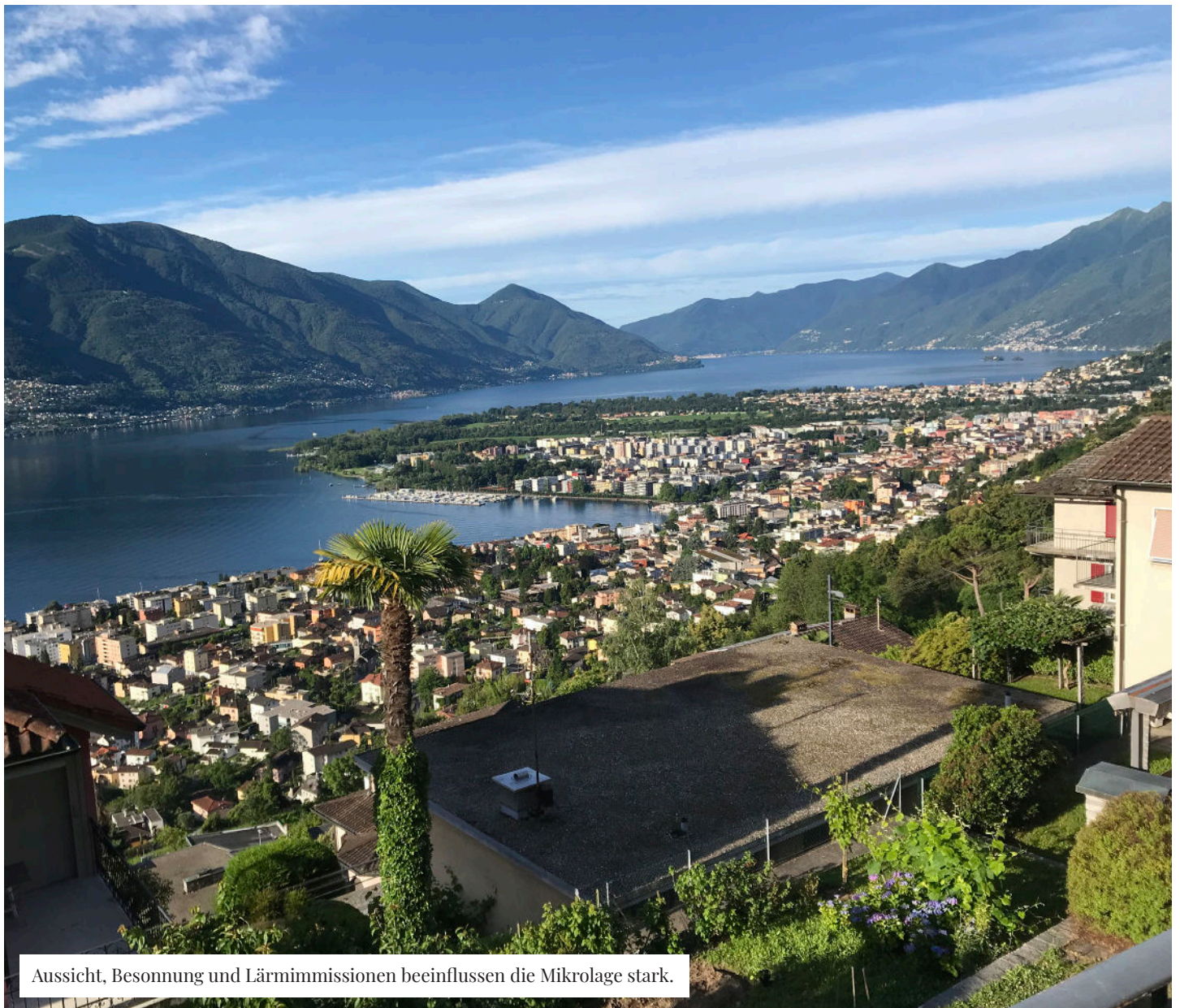
Aussicht, Besonnung und Lärmimmissionen beeinflussen die Mikrolage stark.

Was bestimmt den Wert und das Wertentwicklungspotential einer Liegenschaft? «Lage, Lage, Lage», so lautet eine immer wieder gerne zitierte Immobilienweisheit. Gemäss diesem Sprichwort gibt es also nur drei wirklich wichtige Kriterien, um den Wert einer Immobilie zu bestimmen: 1. die Lage, 2. die Lage und 3. die Lage. Natürlich ist dies übertrieben, denn auch die Grundstücksfläche, das Volumen und der Zustand der Liegenschaft sind für den Liegenschaftswert mitbestimmend. Trotzdem bleibt die Lage ein sehr wichtiger Faktor dafür. Dabei unterscheidet man zwischen der Makrolage und der Mikrolage einer Liegenschaft. Während sich die Makrolage auf die Region, die Stadt oder das Quartier bezieht, beurteilt die Mikrolage die unmittelbare