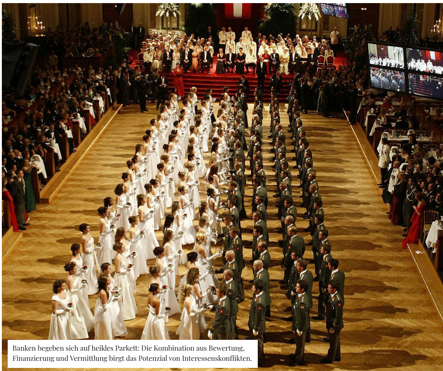
Banken begeben sich auf heikles Parkett: Die Kombination aus Bewertung, Finanzierung und Vermittlung birgt das Potenzial von Interessenskonflikten.

Ein weiteres Beispiel ist Avobis, eine unabhängige Managerin von Hypotheken und Immobilien in der Schweiz. Diese übernahm Anfang 2021 die Bewirtschafterin VERIT Immobilien AG mit ihren 10 Standorten und 150 Mitarbeitenden. Ebenso nennenswert sind die Aktivitäten der Valiant Bank, der Migros Bank, der Kantonalbank des Kantons Waadt (BCV)